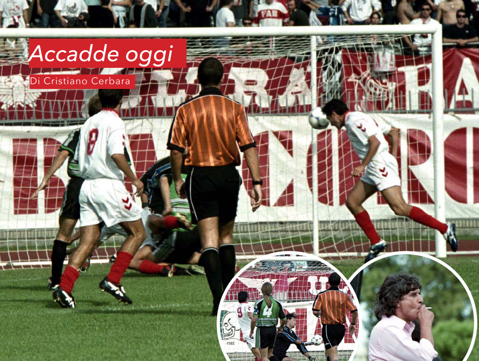
Dalla pagina Facebook "Rimini 100 - una storia biancorossa"